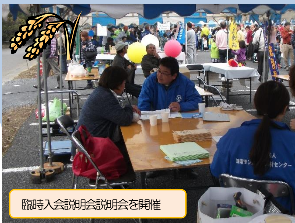
臨時入会説明会説明会を開催