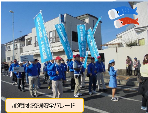
加須地域交通安全パレード