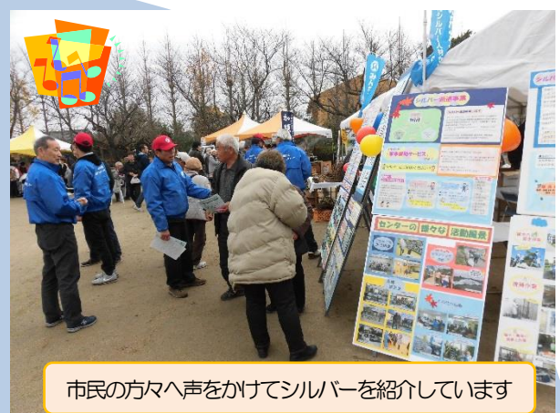
市民の方々へ声をかけてシルバーを紹介しています