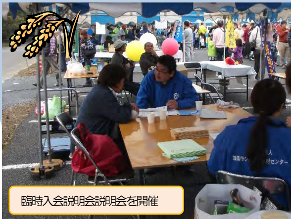
臨時入会説明会説明会を開催